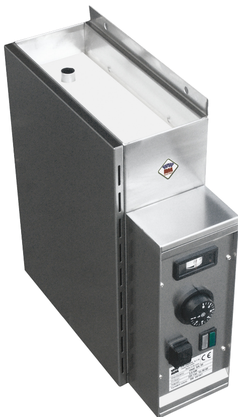
STERILIZÁTOR NOŽOV VODNÝ